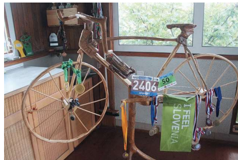
Za 70. rojstni dan je izdelal leseno kolo.